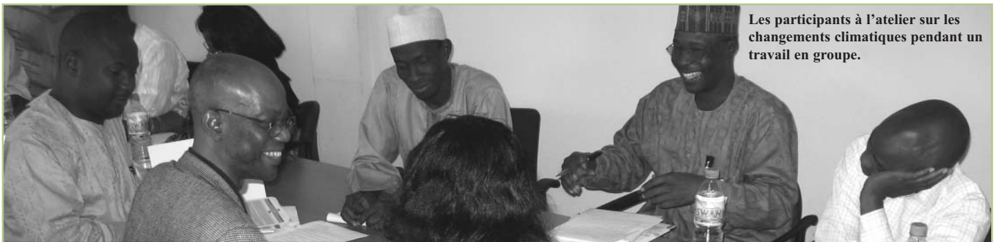
Les participants à l'atelier sur les changements climatiques pendant un travail en groupe.

C'est le deuxième feuilleton auquel ont collaboré les Radios Rurales Internationales et l'ARDA. Le premier était un feuilleton passionnant en 13 épisodes qui donnait de l'information sur la désertification. Les textes radiophoniques de ce feuilleton ont été envoyés à l'origine à nos partenaires en mars 2006, dans le cadre de la Pochette 77, et peuvent être consultés en ligne à l'adresse : http://www.farmradio.org/francais/radio-scripts/77_intro_fr.asp